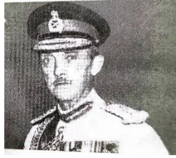
Sir Gerald Templer